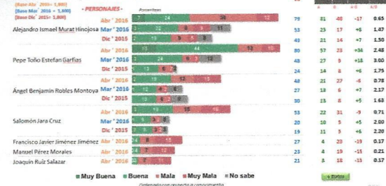
¿Cuál es su opinión hacia...?