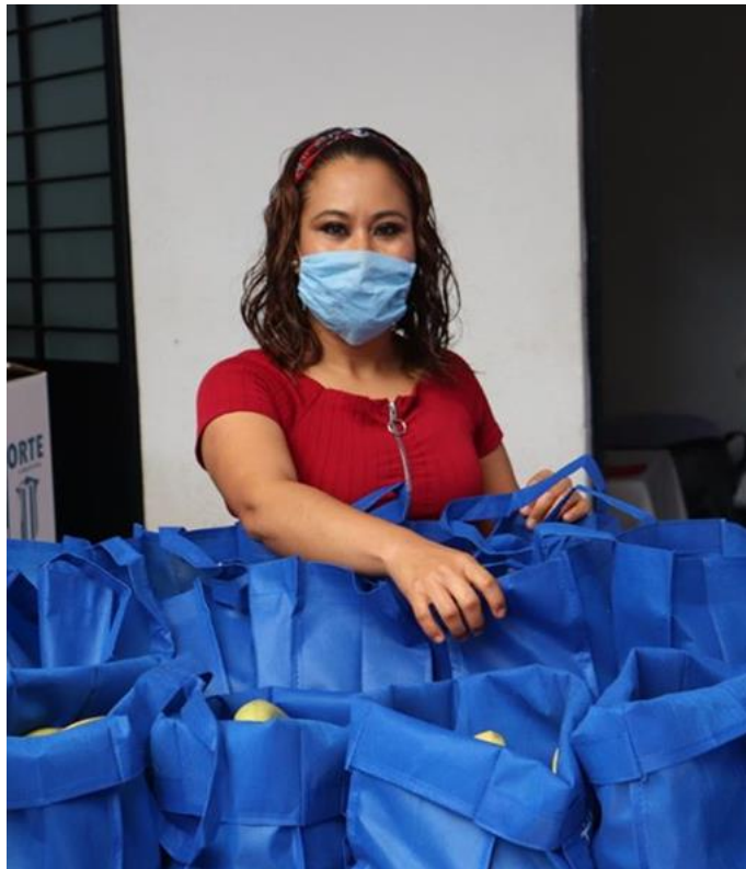
Imagen de bolsas de material textil, objeto de la queja.