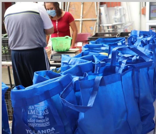
Imagen con imagen y texto ubicados en las bolsas de material textil, objeto de la queja.