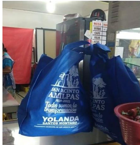
Imagen con imagen y texto ubicados en las bolsas de material textil, objeto de la queja.