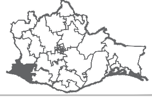
UBICACIÓN DEL DISTRITO LOCAL ELECTORAL EN EL ESTADO