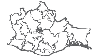
UBICACIÓN DEL DISTRITO LOCAL ELECTORAL EN EL ESTADO